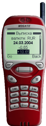
Рис. 5. Просмотр выписки по счету

Для просмотра информации об операциях воспользуйтесь ссылкой Далее . На экране отобразится информация об операциях над счетом: дата совершения операции и сумма операции (если за указанный период операций над счетом не совершалось, то на экране появится сообщение «За указанный промежуток операции по счету не было»).