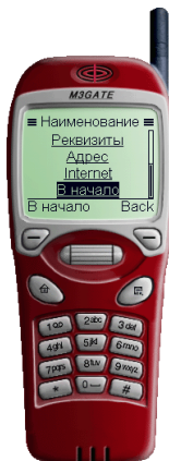
Рис. 3. Просмотр информации о банке

Для просмотра информации о банке выберите в основном меню раздел Информация о банке . На экране мобильного телефона появится список банков, зарегистрированных в системе «iBank 2». Для просмотра подробной информации о банке выберите требуемый банк из списка. На экране отобразится название банка и следующие разделы информации о банке, которые может просмотреть клиент: