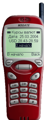
Рис. 4. Просмотр курсов обмена валют банком

Для просмотра курсов валют в главном меню АРМ «WAP-Банкинг» выберите раздел Курсы валют . На экране отобразятся курсы продажи и покупки валют банком на текущий день.