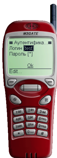
Рис. 2. Ввод логина и пароля клиента

Для просмотра выписок по счетам и выписок по банковским картам (для физических лиц) требуется предварительная аутентификация клиента. Аутентификация производится с помощью логина и пароля, задаваемых администратором iBank 2 при регистрации клиента в системе (см. раздел Регистрация клиента ). Ввод логина и пароля осуществляется выбором ссылки Edit с последующим набором с клавиатуры мобильного телефона требуемой информации в открывшемся разделе редактирования.