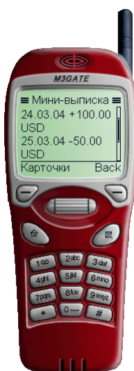
Рис. 7. Просмотр выписки по карте

При выборе карты в списке на экране отразится краткая выписка по карточному счету, в которой отображается дата совершения операции над счетом и сумма операции.